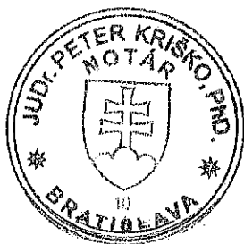
Ivana Csáderová pracovník poverený notárom